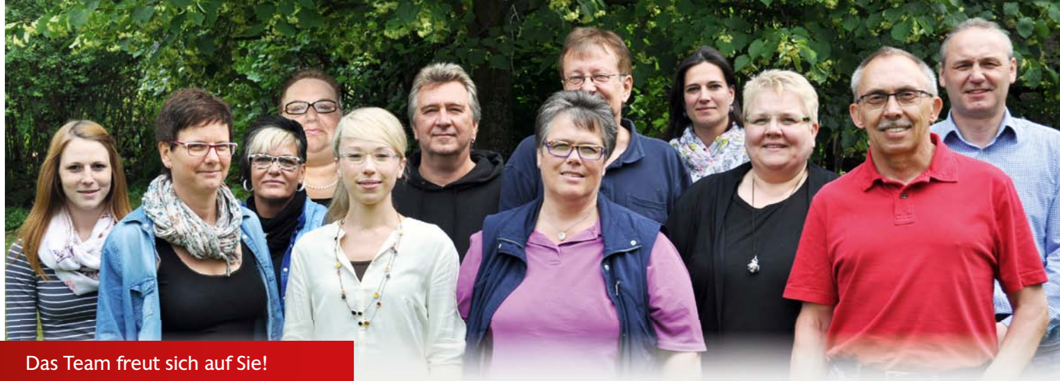
Das Team freut sich auf Sie!