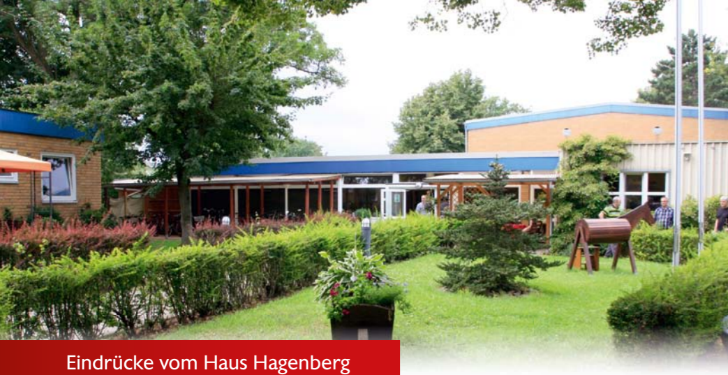
Eindrücke vom Haus Hagenberg