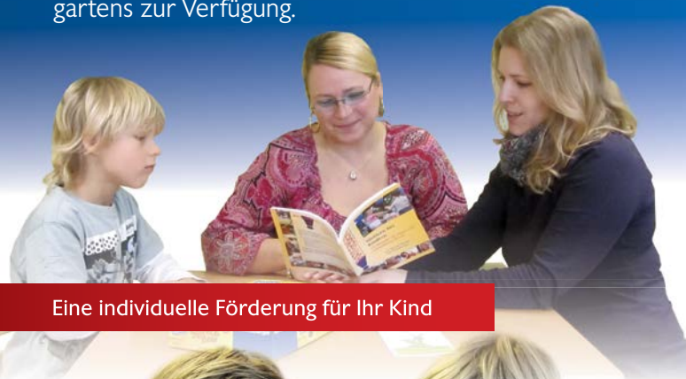
Eine individuelle Förderung für Ihr Kind

Wenn Sie sich Gedanken um die Sprachentwicklung Ihres Kindes machen, können Sie mit uns jederzeit einen Gesprächstermin vereinbaren. Wir unterstützen und beraten Sie gerne, den richtigen Weg für Ihr Kind zu finden. Für Informationen und Gespräche steht Ihnen das Fachpersonal des Sprachheilkindergartens zur Verfügung.