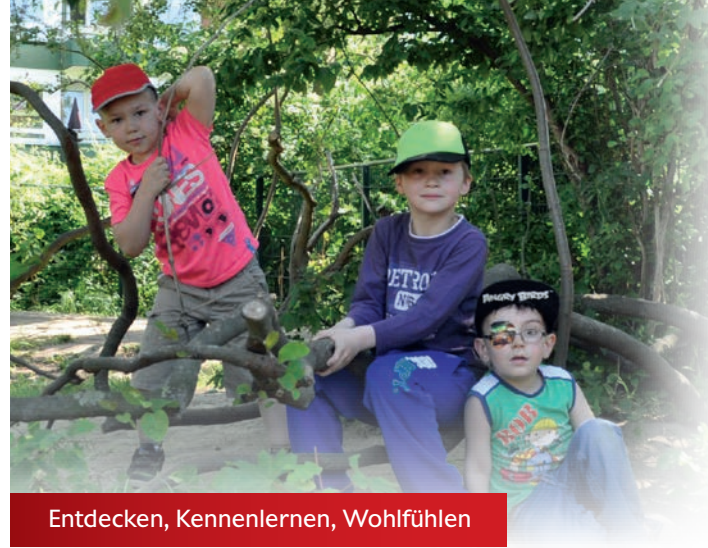
Entdecken, Kennenlernen, Wohlfühlen

Unsere Kita hat an dem Programm „Fitkid“ teilgenommen und ist nach „DGE-Qualitätsstandards für die Verpflegung in Tageseinrichtungen für Kinder“ zertifiziert.